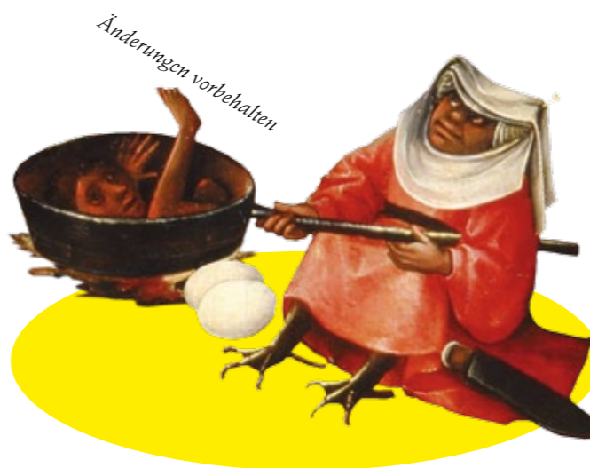
Abbildungen: Collagen mit Details aus Hieronymus Bosch (um 1450/55–1516), Weltgerichts-Triptychon, um 1490 – um 1505, Öltempera auf Eiche und Fotos von Christian Mair; Gestaltung und Karte TOUMAart, Leipzig

Gäste für die Zusatzveranstaltungen 2018 werden noch bekannt gegeben.