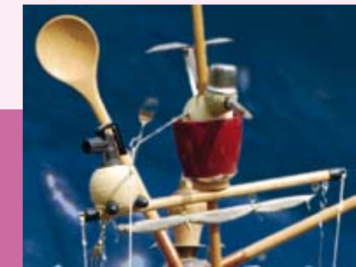
Sjon Brands, Stille Stormooggaai, Detail, 2015, Skulptur aus Alltagsgegenständen © Sjon Brands

Anmeldung nicht erforderlich, Einstieg jederzeit möglich Eintritt und Teilnahme am Atelier gratis