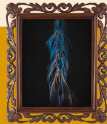
Oliver Mark, Natura Morta #42, 2016, Photographie in historischem Rahmen © Oliver Mark