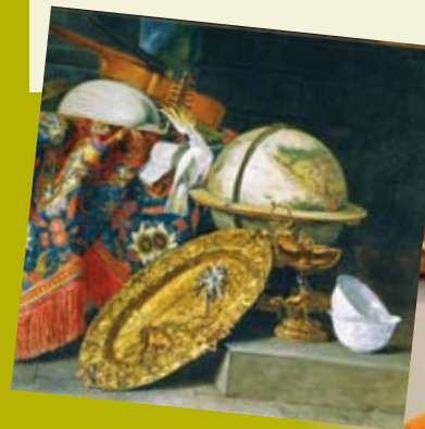
Pieter Boel, Stilleben mit Globus und Kakaadu, Detail, um 1658, Öl auf Leinwand

Offenes Atelier im Rahmen der Ausstellung »Bosch & Brands. Korrespondenzen«